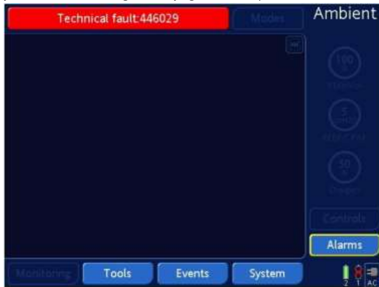
Joonis 1. Displeile kuvatakse "Ambient State" koos punase tehnilise vea ja numbri teatega. (Näide, kuvatav tehnilise vea number võib on erinev.)

Režiimis Ambient state (Avamine toaõhule) aktiveeruvad hingamisaparaadil heli- ja visuaalne alarm ning avaneb järgnev ekraanipilt: