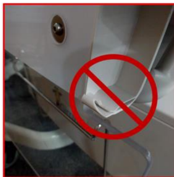
Joonis 1C. Katkine riiv