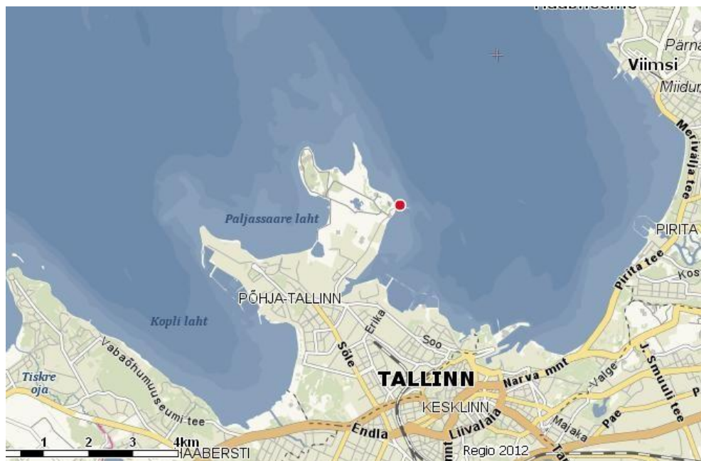
Kaart 1. ● Pikakari rand

Niine tänav 2 10414 Tallinn Telefon: 645 7040 Faks 645 7099 e-post: pohja@tallinnlv.ee